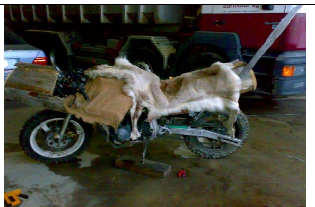
Susi im Kostüm 2008 (Motto: Hägar)